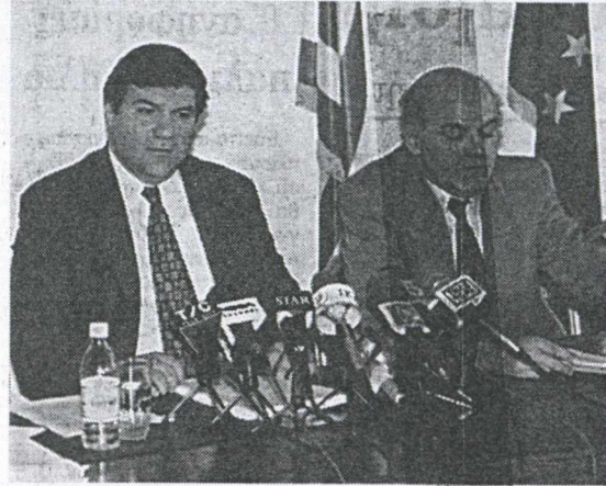
Ο υπουργός Μεταφορών Χ. Καστανίδης (αριστερά) θα εισηγηθεί στην Κυβερνητική Επιτροπή λύσεις για την απεμπλοκή της επικείμενης προμήθειας των ψηφιακών του ΟΤΕ από τη δίνη των δικαστικών εξελίξεων, προκειμένου ο Οργανισμός να συνεχίσει απόσποπα το επενδυτικό του πρόγραμμα.