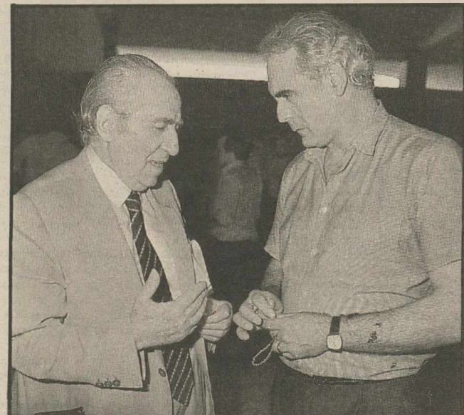
Προσεκτικά ακούει τον Γ. Αλεξούρα ο Ακης Τσοχατζόπουλος σε ένα διάλειμμα της χτεσινής Κ.Ε. Αραγε συζητούν το τι θα ψηφίσουν σήμερα;

«Αφέλεια...» Ο πρώην Πρωθυπουργός υιοθέτησε εν μέρει μερικές από τις παρατηρήσεις και τα συμπεράσματα της επιτροπής, που είχε συσταθεί για να αναλύσει το εκλογικό αποτέλεσμα, υποβαθμίζοντας όμως τη δική του ευθύνη, ενώ δεν παρέλειψε να καταγγείλει και το «παγκόσμιο δίκτυο αντίδρασης που έπρεπε και στην Ελλάδα να ριζέει και να διασπαστεί το σοσιαλιστικό εθνικό κίνημα».