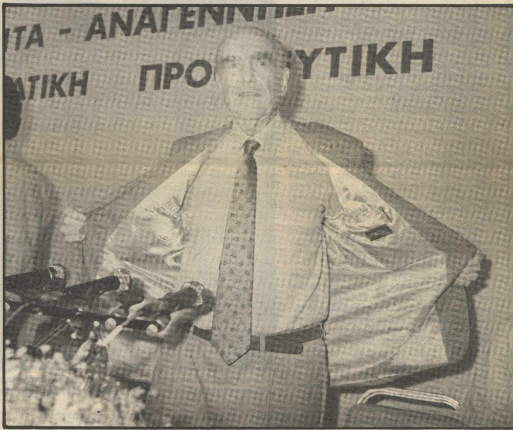
Η ζώστη «έπιασε» από την αρχή τον κ. Α. Παπανδρέου κι έβγαλε το σακάκι του. Αν παρέμεινε στην αίθουσα κι άκουγε τη συνέχεια θα φούντωνε τόσο που ούτε τα αρ κοντίσιον δεν θα τον δρόσιζαν...

Σ ΤΟ ξενοδοχείο «Ξενία — Ηλιος» άρχισε χτες η συνεδρίαση της Κεντρικής Επιτροπής του ΠΑΣΟΚ.