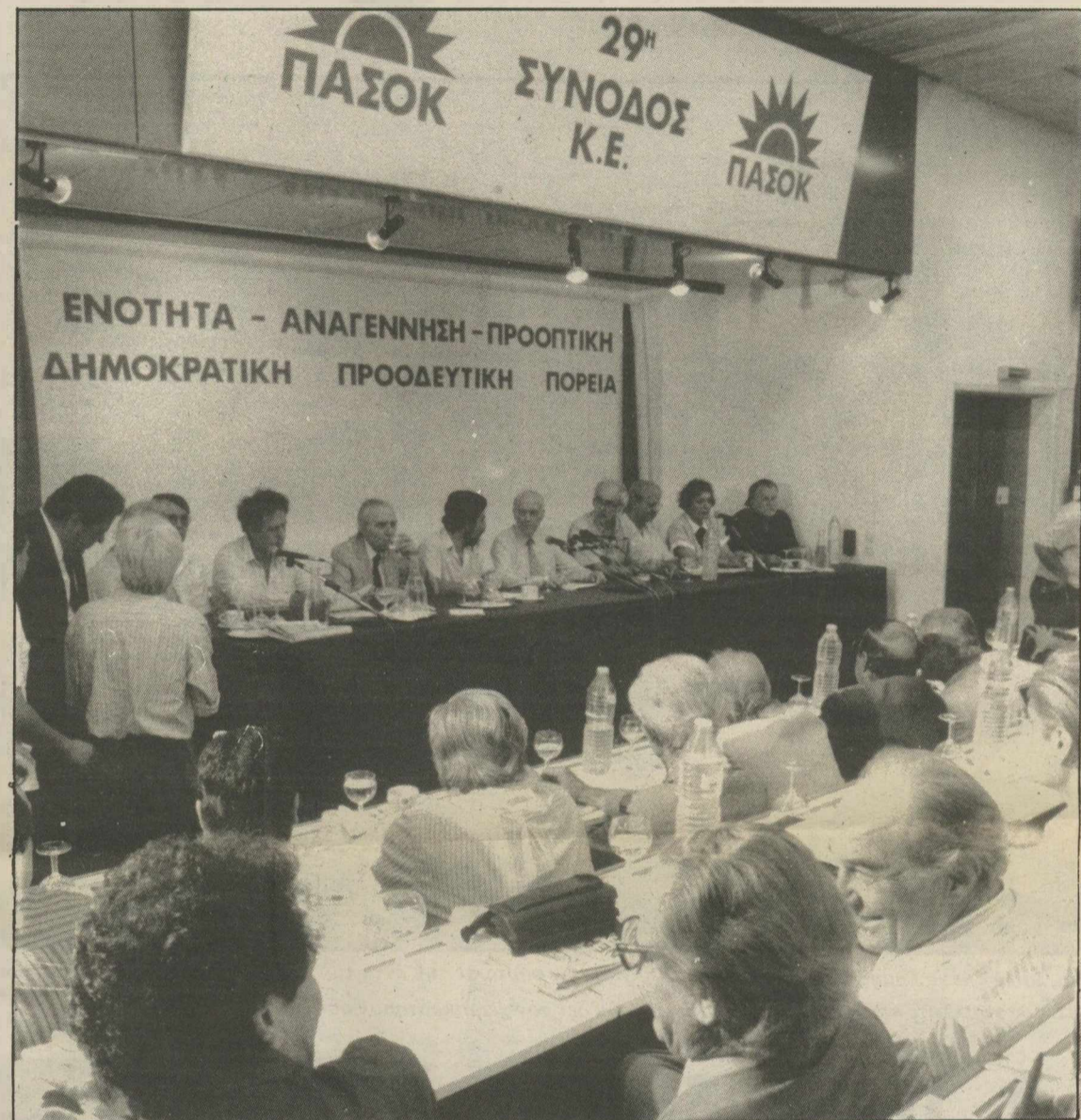
Λίγο πριν την έναρξη της χθεσινής πρώτης μέρας της 29ης Συνόδου της Κ.Ε. του ΠΑΣΟΚ, ο κ. Παπανδρέου συνομιλεί με τον Γ. Γεννηματά.

Μ' ΕΝΑ κείμενο εκτός πραγματικότητας τόπου και χρόνου - το οποίο κι αναμένεται να καταψηφιστεί - ο κ. Α. Παπανδρέου εμφανίστηκε χθες στην Κ.Ε. του ΠΑΣΟΚ επιχειρώντας να πείσει τα στελέχη του για την «τεράστια οκταετή προσφορά του ΠΑΣΟΚ στη χώρα», αναγορεύοντας μάλιστα, την πρόσφατη συντριπτική του ήττα στις εκλογές ως νίκη του ΠΑΣΟΚ.