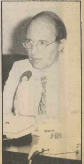
Ο κ. Σημίτης

■ Ο κ. Δ. ΤΣΟΒΟΛΑΣ σε ομιλία του στην Ελευσίνα, τόνισε χθες ότι «στους τρεις μήνες της συγκυβέρνησης με το πρόσημα της κάθαρσης, η Ν.Δ. με τη στήριξη της ηγεσίας του Συνασπισμού προώθησαν την αντιλαϊκή πολιτική της φιλελεύθερης οικονομίας, επιτρέποντας αυξήσεις αλόγιστες στα βασικά είδη διατροφής, μειώνοντας τις συντάξεις και παρέχοντας δισεκατομμύρια στα μεγάλα οικονομικά συγκροτήματα».