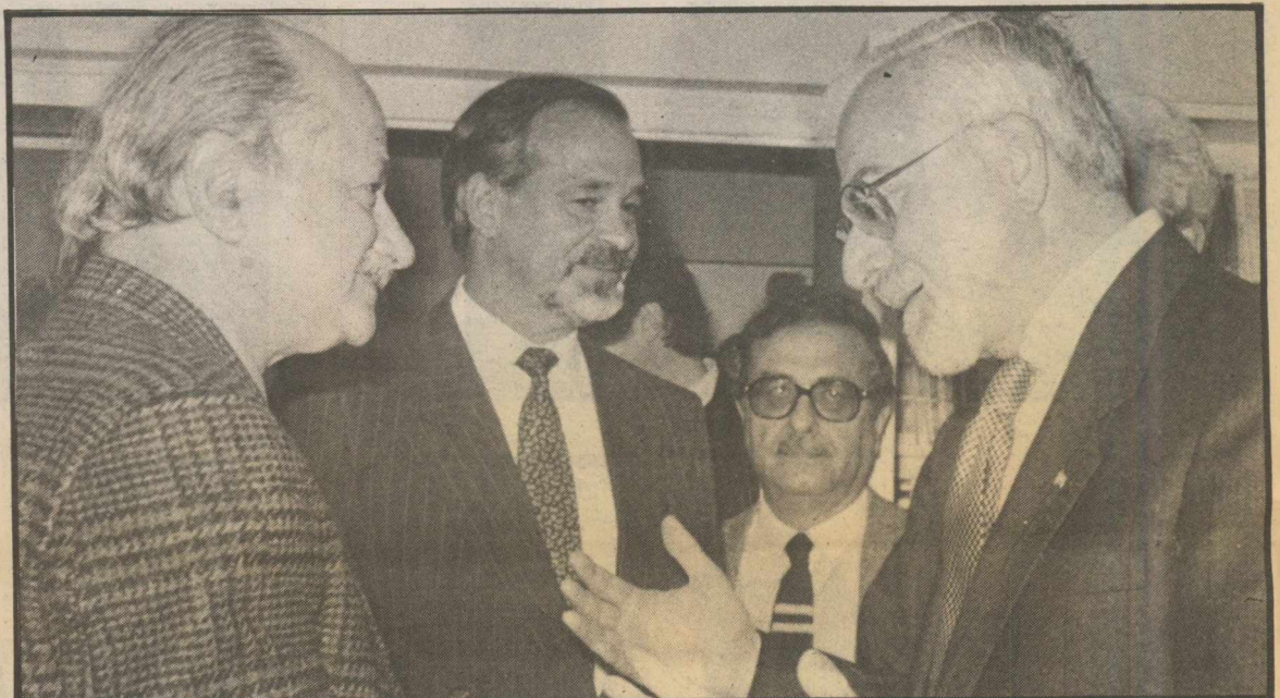
Ο Α. Κύρκος, χτες, με τον πρεσβευτή των ΗΠΑ Μ. Σωτήρχο.

Ο νέος Αμερικανός πρεσβευτής Μάικλ Σωτήρχος επισκέφτηκε τον Χαρίλαο Φλωράκη στα γραφεία του Συνασπισμού στην Ομόνοια στις 6 το απόγευμα. Μετά τη συνάντηση, που κράτησε μισή ώρα, ο Χαρίλαος Φλωράκης δήλωσε: • «Η επίσκεψη ήταν εθιμοτυπική. Είχε την καλοσύνη ο νέος πρεσβευτής των ΗΠΑ να μας επισκεφτεί και με την ευ-