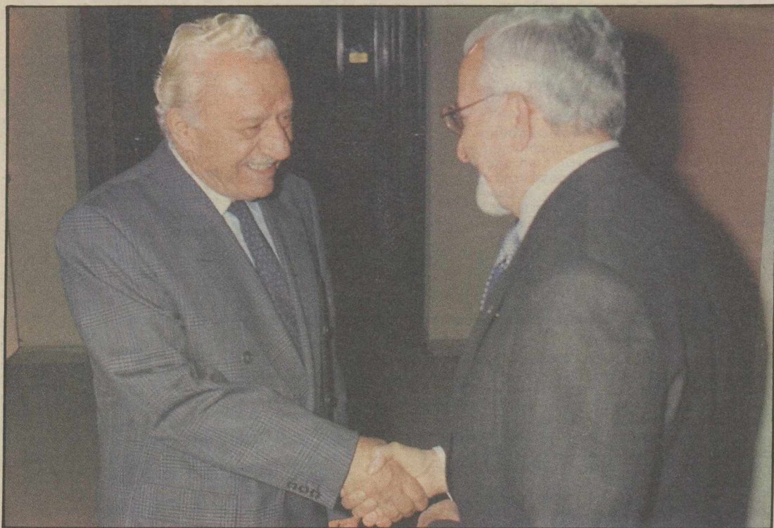
Μια χειραψία με χαμόγελα μεταξύ Φλωράκη - Σωτήρχου χτες στα γραφεία του Συνασπισμού.

Ιστορική συνάντηση Αμερικανού πρέσβη με Φλωράκη και Κύρκο