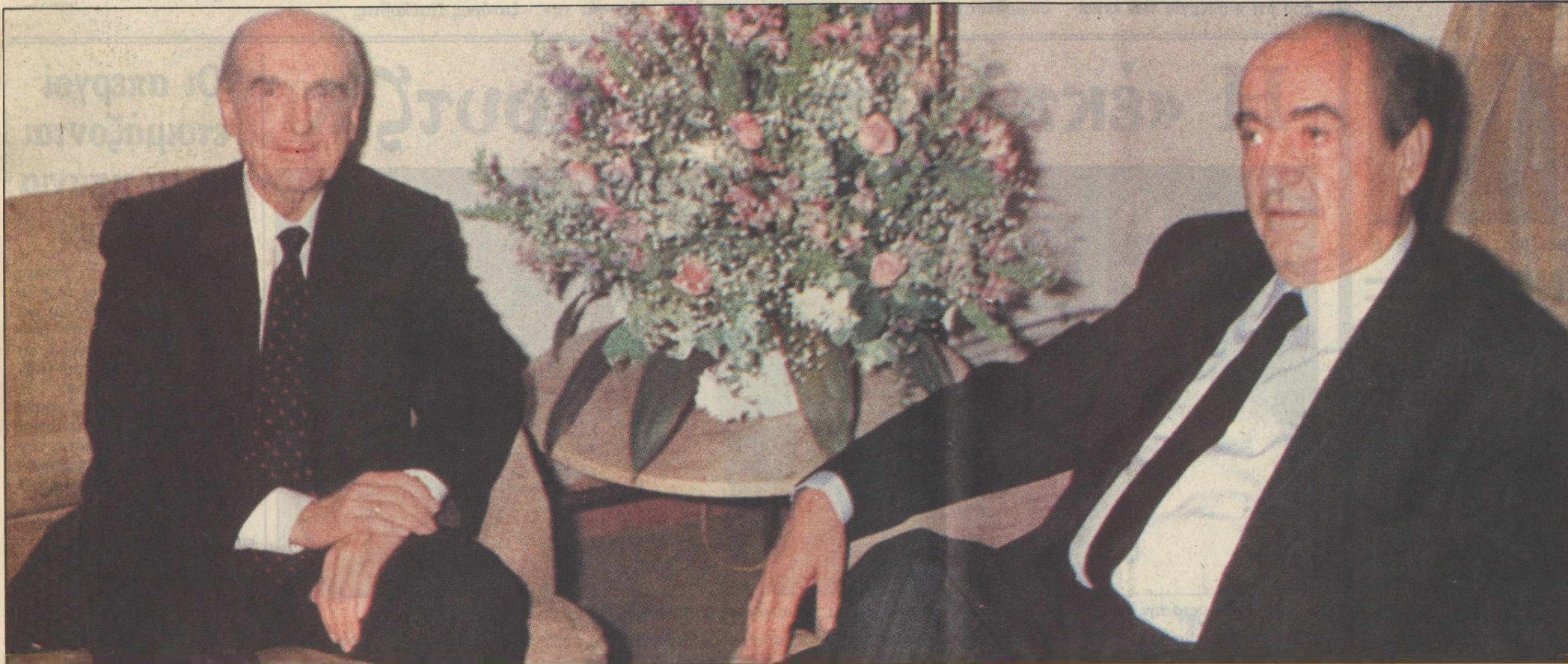
Μητσοτάκης - Παπανδρέου: Η αρχή του τέλους των συγκρούσεων ξεκίνησε με την Οικουμενική. Τα χρονικά περιθώρια για αναμόλυνση της διαμάχης τα περιορίζουν οι επιταγές της ΕΟΚ για το «τι δέον γενέσθαι».