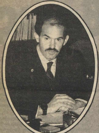
Γ. Παπανδρέου (37 χρόνων): παρά τη σημαντική πολιτική φθορά που υπέστη τους τελευταίους μήνες της κυβέρνησης του ΠΑΣΟΚ, παραμένει από τα στελέχη που και λόγω ονόματος θα διαδραματίσουν σοβαρό ρόλο στο μέλλον