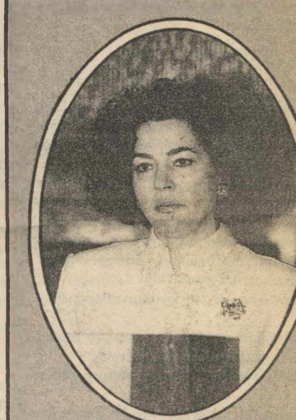
Βάσω Παπανδρέου: στέλεχος με αναμφισβήτητες ικανότητες. Το 1993 λήγει η θητεία της στην ΕΟΚ, οπότε και θα επιστρέψει στην ενεργό πολιτική με ευρωπαϊκή πείρα