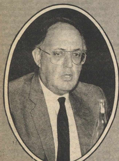
Θεόδωρος Πάγκαλος (52 ετών): πολιτικός με ιδιαίτερες ικανότητες και πληθωρική προσωπικότητα. Αν και έλκει την καταγωγή του από την ΕΔΑ και το ΚΚΕ εσωτερικού, οι σχέσεις του με την Αριστερά είναι κακές λόγω των κατά καιρούς ιδιαίτερα επιθετικών δηλώσεών που έχει κάνει

2 Η ΠΕΡΙΟΔΟΣ της διακυβέρνησης του ΠΑΣΟΚ έχει αφήσει βαθιά τα σημάδια της πάνω στον κορμό του Κινήματος. Για οκτώ ολόκληρα χρόνια το κόμμα είχε περάσει σε δεύτερη μοίρα, είχε γίνει ουσιαστικά ένας εκλογικός μηχανισμός που απλά παρακολουθούσε και αναπαρήγε τις ενδοκυβερνητικές εριές.