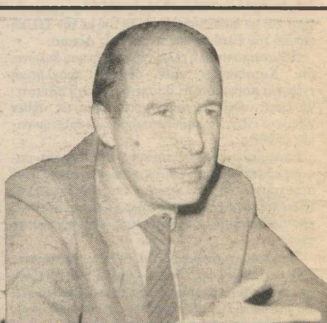
Κώστας Σημίτης (54 ετών): ικανός τεχνοκράτης με ολοκληρωμένες και συγκροτημένες πολιτικές προτάσεις