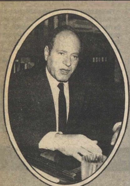
Γεράσιμος Αρσένης (59 ετών): από τα πιο αμφιλεγόμενα πρόσωπα στο ΠΑΣΟΚ. Μετά τη ρήξη του με τον κ. Α. Παπανδρέου και τη διαγραφή του, πολλοί πιστεύουν ότι ήρθε το πολιτικό του τέλος. Κατάφερε όμως να επανέλθει και μάλιστα με την ισχυρή υποστήριξη της Εκκλησίας