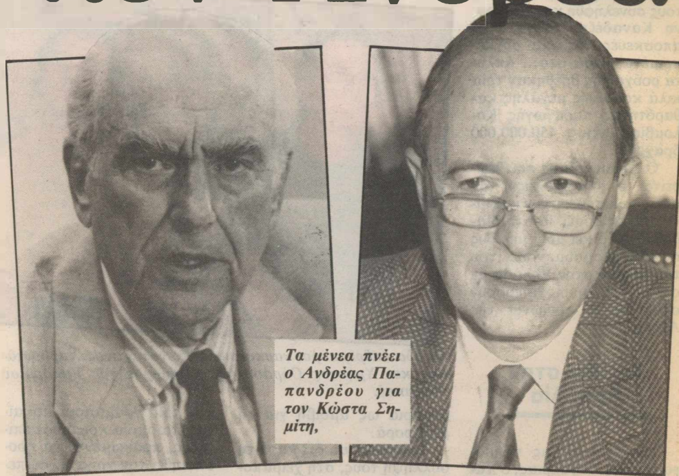
Τα μένεα πνέει ο Ανδρέας Παπανδρέου για τον Κώστα Σημίτη.

Βασικό επιχείρημα του κ. Σημίτη είναι ότι κατέχει την εναλλακτική πρόταση, τις νέες ιδέες που χρειάζε-