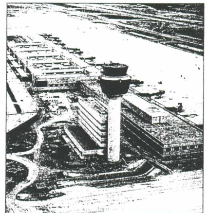
Αεροδρόμιο Σπάτων. Μέσω της εξαγοράς μετοχών της Ο.Α. η British Airways σκοπεύει να ισχυροποιηθεί στο νέο αεροδρόμιο των Σπάτων

ενδιαφέρον για την αγορά πακέτου μετοχών της Ο.Α. είναι η εξασφάλιση-ισχυροποίηση της παρουσίας της στο νέο διεθνές αεροδρόμιο της Αθήνας. Αναφέρουν συγκεκριμένα ότι με τα χρήματα που θα διαθέσει η British Airways για την εξαγορά μειοψηφικού πακέτου μετοχών της Ο.Α. θα εξασφαλίσει και την υποστήριξη των υπηρεσιών της Ο.Α. (τεχνικές υπηρεσίες, χάντλινγκ, καύσιμα κ.λπ.) κατά τη λειτουργία της στο αεροδρόμιο των Σπάτων. Σημειώνεται ότι με ανάλογο τρόπο η British Airways ισχυροποίησε πέρυσι την παρουσία της στα ισπανικά αεροδρόμια (εξαγόρασε μικρό πακέτο μετοχών της αεροπορικής εταιρείας Iberia).