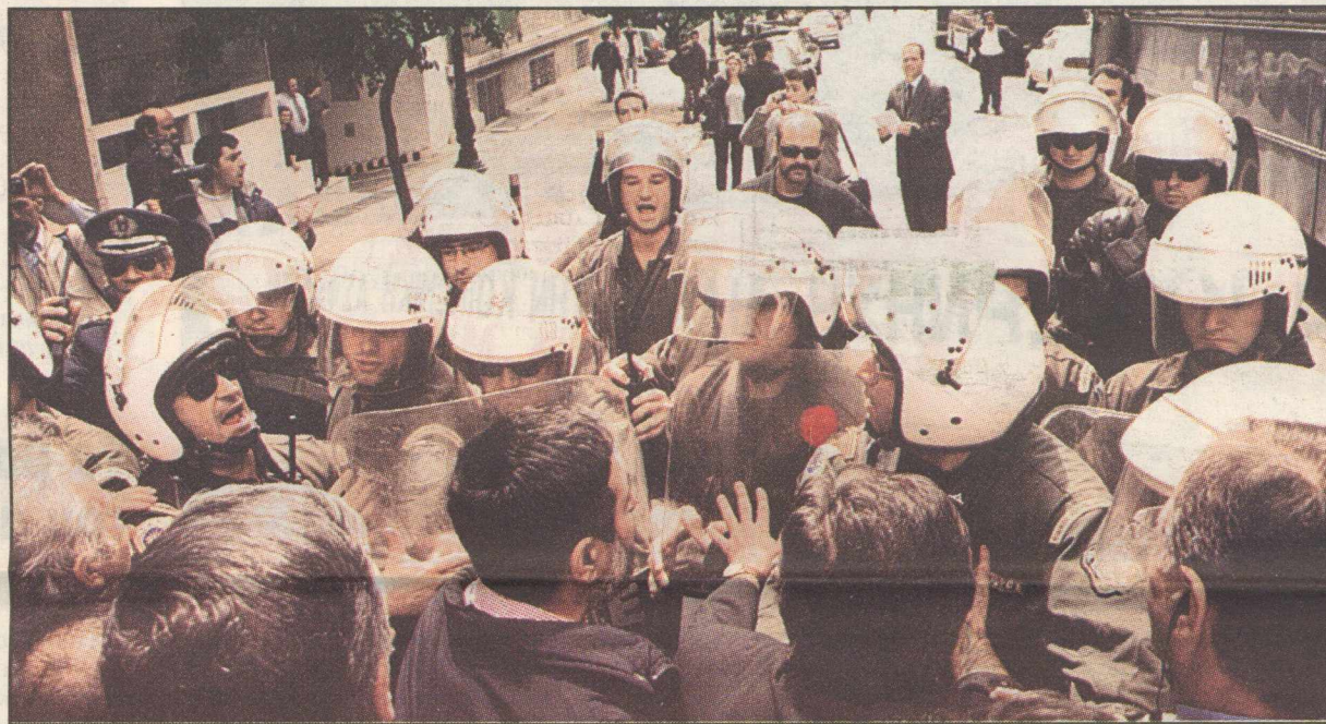
Κοινωνικές εντάσεις θα πυροδοτήσουν οι παραλογισμοί του λεγόμενου νέου ασφαλιστικού συστήματος

1 Η εισήγηση αναφέρει ότι διά των (εισπρακτικών) μέτρων εξοικονομούνται 21 τρισ. δρχ. τα επόμενα 25 έτη, διάστημα κατά το οποίο το αναλογιστικό έλλειμμα, σύμφωνα με τις επεξεργασίες των μελετητών της Government Actuary's ανέρχεται στα 120 τρισ. δρχ. Υπό αυτά τα δεδομένα και αν ο προϋπολογισμός συνεχίζει να χρηματοδοτεί το σύστημα ακόμη και με 2 τρισ. επίσης, όσα κατά τους Βρετανούς εκταμιεύτηκαν το 2000 για τις συντάξεις των δημοσίων υπαλλήλων (0,7 τρισ.) και αποδόθηκαν στα άλλα ταμεία (1,3 τρισ.), σημαίνει ότι το αναλογιστικό έλλειμμα παραμένει περί τα 50 τρισ. δρχ. Αυτή η παραδοχή, στις προτάσεις Γιαννίτση, αποκαλύπτει ότι οι σκληρές παρεμβάσεις αφενός στερούν αναμενόμενες παροχές από τους