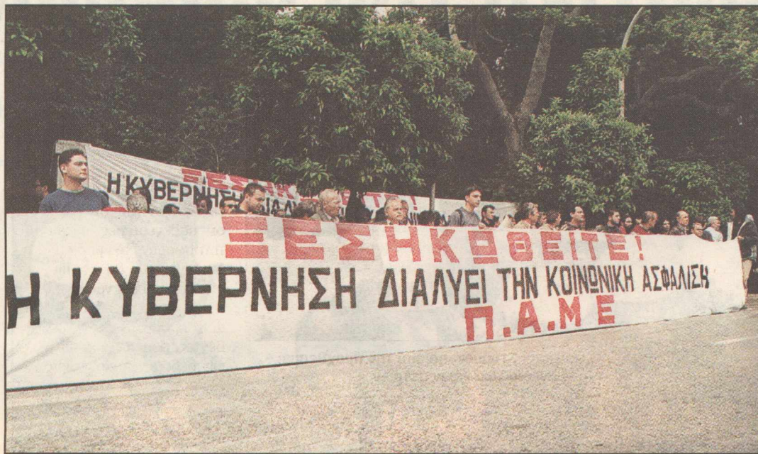
Τα κυβερνητικά σχέδια κινητοποιούν αλλά και αναγκάζουν τις παρατάξεις σε ουσιαστικές συγκλίσεις