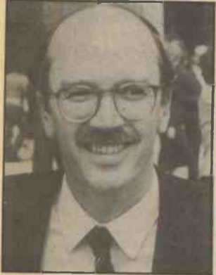
Ο Π. Ρουμेलιώτης στη θέση του Κ. Σημίτη