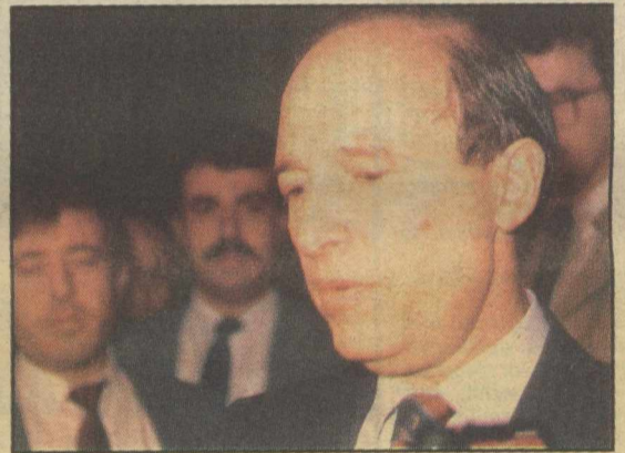
«Συζητήσαμε για ορθές διαδικασίες και συνέπεια», δήλωσε σιβυλλικά ο κ. Σημίτης μετά τη νυχτερινή συνάντησή του με τον Πρωθυπουργό

Ακαρπη νυχτερινή συνάντηση με Ανδρέα Αρνήθηκε το Παιδείας Μάταιες κρούσεις σε Λάζαρη - Κουλουριάνο Ρουμελιώτης ο διάδοχος