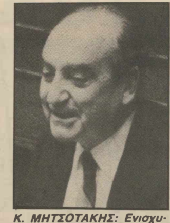
Κ. ΜΗΤΣΟΤΑΚΗΣ: Ενισχυμένη αναλογική και σταυρός.

Ο πρόεδρος της ΝΔ είπε ότι η επιστολή Σημίτη είναι «ένα πλήρες οικονομικό πρόγραμμα» που αποκαλύπτει ότι ο Πρωθυπουργός είχε εγκρίνει την εισοδηματική πολιτική και επιρρίπτει ευθύνες στον Πρωθυπουργό διότι παρά τις αλληλέγγυες προτάσεις του δεν δέχθηκε τη μείωση των μεγάλων ελλειμμάτων του δημοσίου τομέα.