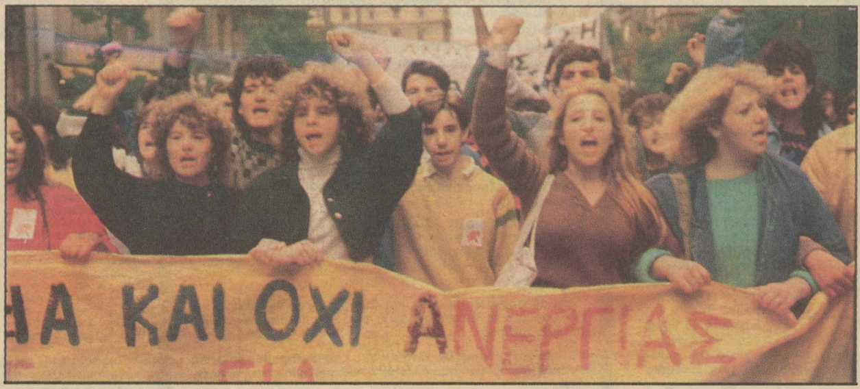
Εκτακτη επιχορήγηση 859 εκατ. δραχμών ανακοινώνει ο Τρίσης ● ΣΕΛ. 24-25