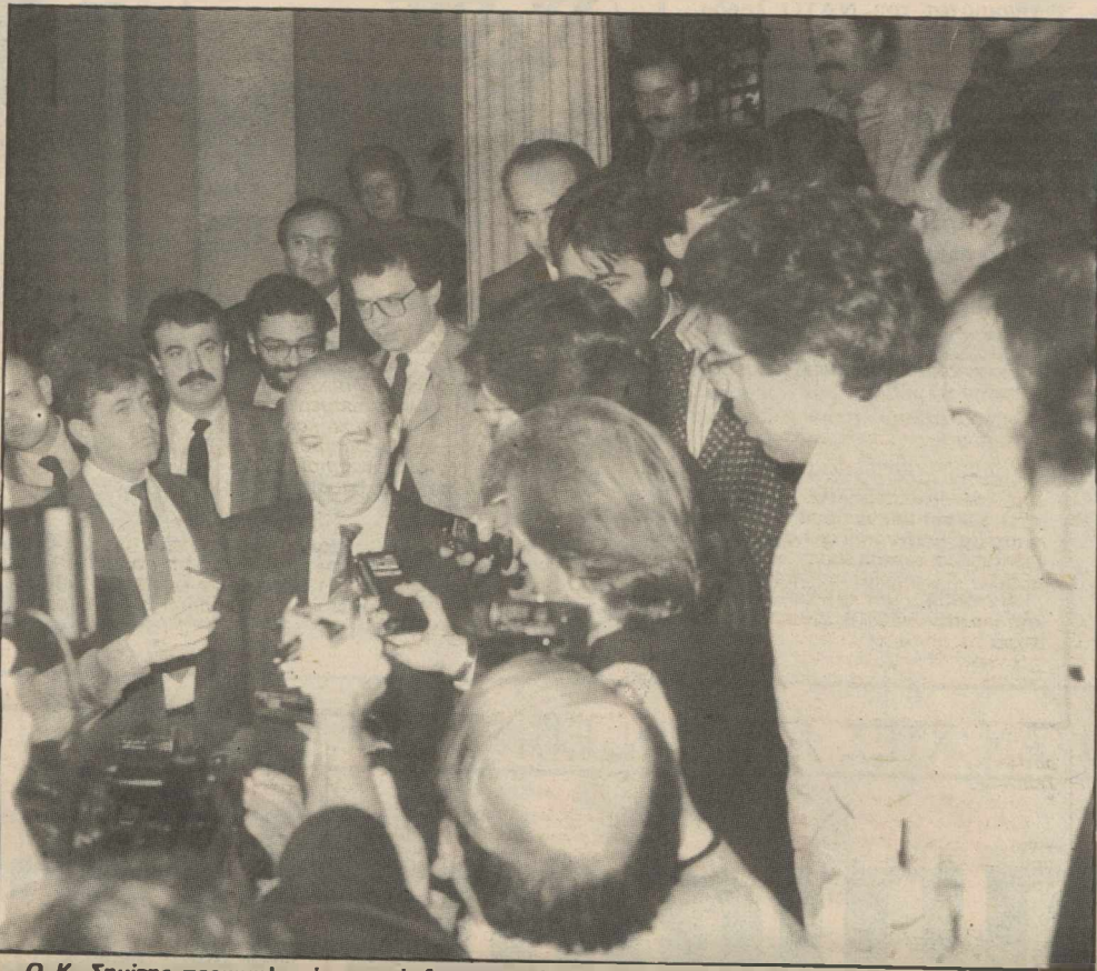
Ο Κ. Σημίτης περικυκλωμένος από δημοσιογράφους έξω από το Μαξίμου, μετά τη χθεσινή συνάντησή του με τον Ανδρέα

βράδυ οποιαδήποτε σχετική πληροφορία, αλλά δεν θέλησε να αναφερθεί στο τι διαμείφθηκε στη συνάντησή με τον πρωθυπουργό.