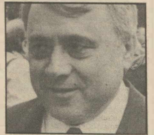
Ο Γρ. Σολωμός από υφυπουργός Παιδείας, υφυπουργός Υγείας

ΜΕΤΑΚΙΝΗΣΗ του υφυπουργού Παιδείας Γρηγόρη Σολωμού στο υφυπουργείο Υγείας και Πρόνοιας ανακοινώθηκε ξαφνικά χτες το βράδυ.