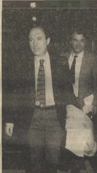
Ο κ. Σημίτης φεύγει από τη θέση του. Θα φύγει μαζί του και η μετριοπαθής οικονομική του πολιτική.

Στο μεταξύ επιβεβαιώθηκε χθες το μεσημέρι και επίσημα (και μεταδόθηκε από τα κρατικά μέσα) η προχθεσινή παραίτηση του υπουργού Εθνικής Οικονομίας κ. Κ. Σημίτη και δόθηκαν στη δημοσιότητα οι ανταλλαγιστές με τον Πρωθυπουργό επιστολές. Ο κ. Συνέχεια στη σελ. 14