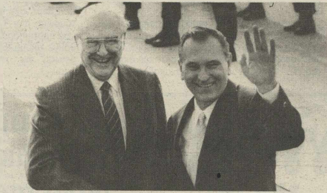
Ο πρωθυπουργός Α. Παπανδρέου υποδέχεται τον Ούγγρο πρωθυπουργό Κάροϊ Γκρος

Χτες βράδυ ο πρωθυπουργός Α. Παπανδρέου παρέθεσε επί-