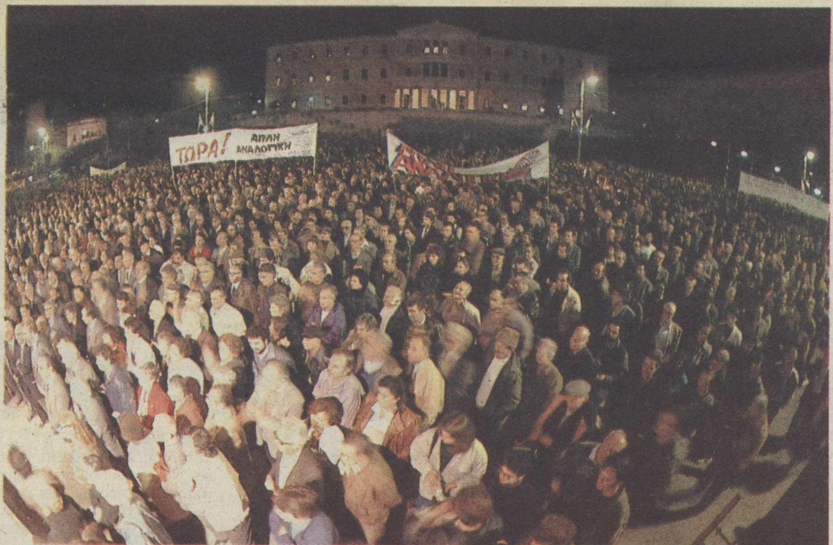
Πολλές χιλιάδες λαού έξω από τη Βουλή (φωτογραφία) απαιτούν την άμεση καθιέρωση της απλής αναλογικής. Μέσα στη Βουλή την ίδια ώρα συζητούνταν η πρόταση νόμου των 12 βουλευτών

τηθούν και άλλα πράγματα που έχει ανάγκη η ελληνική κοινωνία! Η τοποθέτηση αυτή, που επιβεβαιώνει ότι η κυβέρνηση επιμένει στην εκκρεμότητα του εκλογικού νόμου για